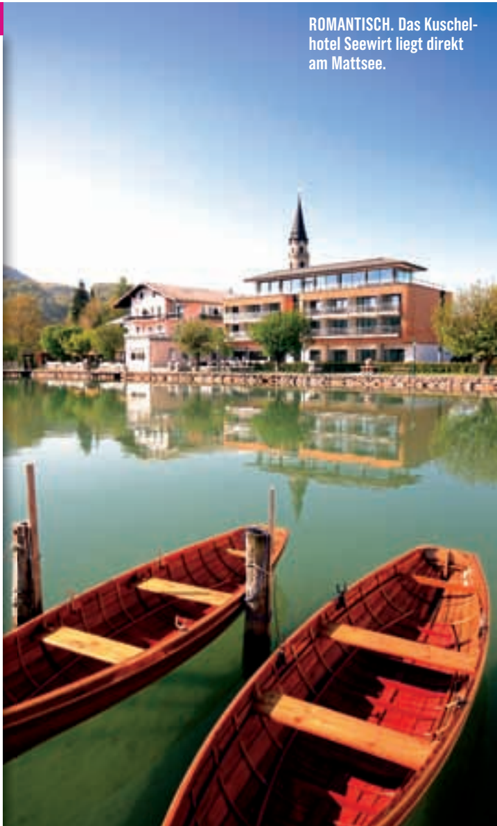
ROMANTISCH. Das Kuschelhotel Seewirt liegt direkt am Mattsee.

■ SEEBRUNN LIVING HOTEL. Stylish Herberge mit Wellness-Bereich, direkt am Wallersee gelegen. DZ ab 45 Euro. Fenning 7a, 5307 Henndorf; www.seebunn.at