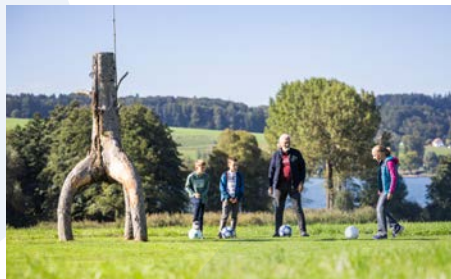
Fußballgolf Mattsee Geschicklichkeit & Spaß für Groß & Klein www.fussballgolf.zone

Pumptrackbahn, Calisthenics Geräte, Beachvolleyball, Tennis, Bewegungspark Elixhausen, Henndorf und Schleedorf www.salzburger-seenland.at/aktivitaeten