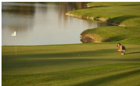
Golfclub Altentann Henndorf am Wallersee Erster von Jack Nicklaus designtem Golfplatz Europas www.gutaltentann.com