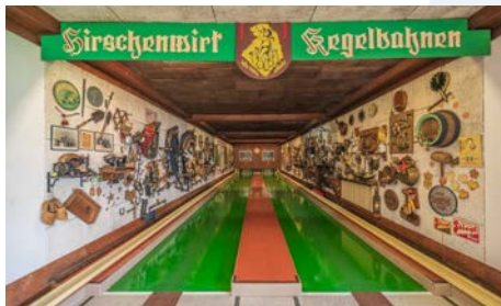
Kegeln Seekirchen am Wallersee Beim Hirschenwirt die Kugel rollen lassen www.hirschenwirt-seekirchen.at